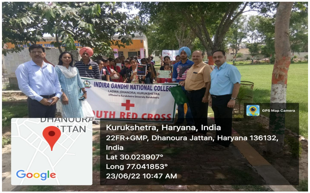
Figure 4: Government School, Dhanora—Starting point of rally