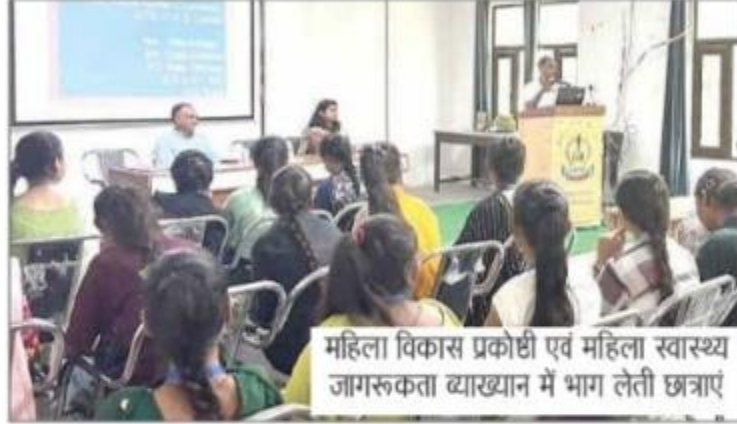
महिला विकास प्रकोष्ठी एवं महिला स्वास्थ्य जागरूकता व्याख्यान में भाग लेती छात्राएं