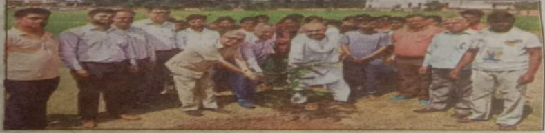
लाडवा के गाँव मथाना में पौधारोपण करते कालेज पदाधिकारी, सदस्य व स्वयंसेवक।