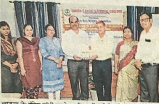
लाडवा के इंदिरा गांधी कालेज परिसर में अतिथि को स्मृति चिन्ह देकर सम्मनित करते स्कूल के प्राचार्य।