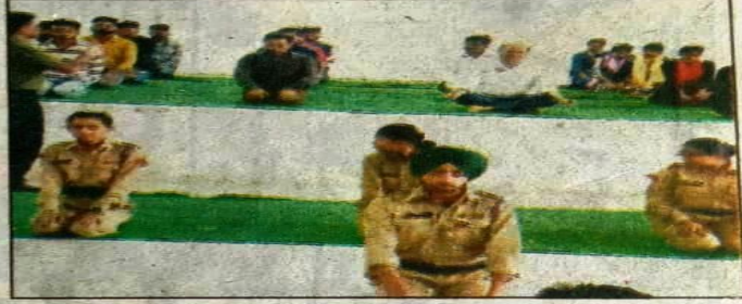
कालेज में योग शिविर में भाग लेते स्टाफ व बच्चे।