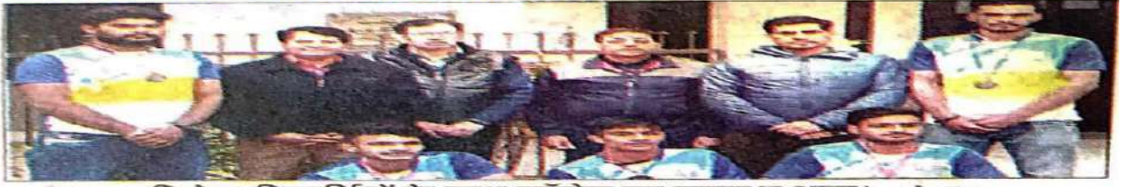
विजेता विद्यार्थियों के साथ कॉलेज का स्टाफ व अन्य। संवाद